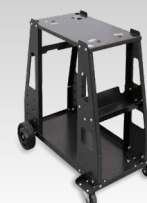
Chariot PLASMA 600 040298