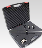
Kit compas 040205