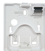
TASTA Montageschale zur Montage auf Wand und UP-Dose (im Lieferumfang enthalten)