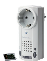
Funksignalgerät für Serie TASTA