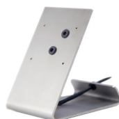
Tischzubehör TASTA Audio und Video