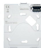
TASTA Montageplatte zur Montage auf UP-Dose