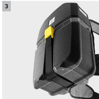
3 Hochinnovatives EPP (expandiertes Polypropylen)