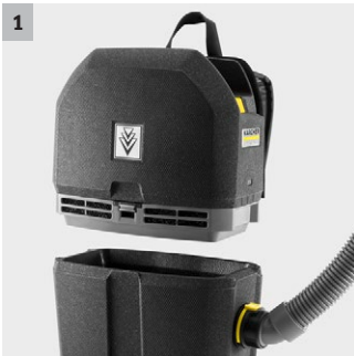
1 Bürstenloser EC-Antrieb

Eignet sich perfekt für das Reinigen auf engstem Raum: der ultraleichte, leistungsstarke akku-betriebene Rucksacksauger BVL 5/1 Bp Pack aus innovativem, sehr robusten EPP-Material.