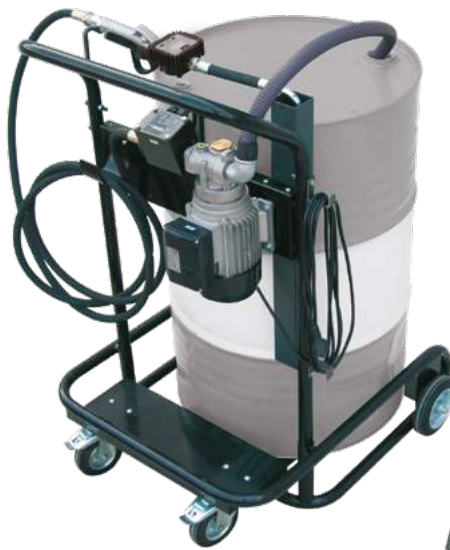
VISCOTROLL GEAR AC