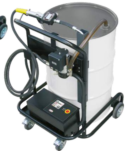
VISCOTROLL GEAR DC