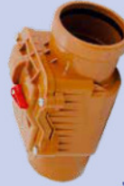
TYP1 ø110 9-5000-110-00-03-11