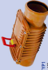
TYP1 ø125 9-5000-125-00-03-11