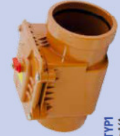
TYP1 ø160 9-5000-160-00-03-11