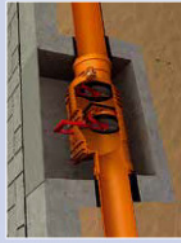
Doppelte Schutz vor den Nagelieren