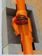
Schutz vor Nagelieren