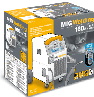
REF 033160 Livré avec câble de masse et torche Euro 2,2m