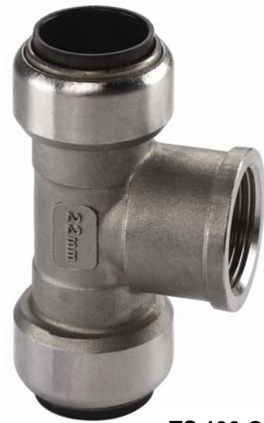
TS 130 G, T-Stück mit Abgang, I/IG (IG nach DIN EN 10226-1)