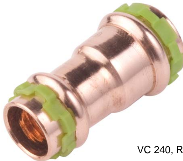
VC 240, Reduziermuffe