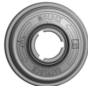
Rückseite 9030 mit den neuen Symbolen „Filter paarweise tauschen“ und „Benutzerinformation lesen!“