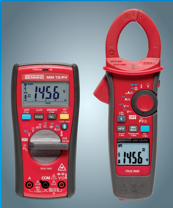
Optional für CM 10-PV BENNING CFlex 1 (044068)