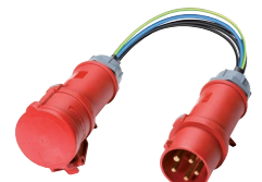
Messadapter (044127/044128) z.B. für CM 9-1