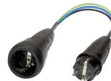
Messadapter (044131) z.B. für CM 9-1