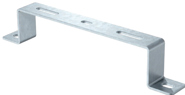
Distanzbügel für Kabel- und Gitterrinnen.