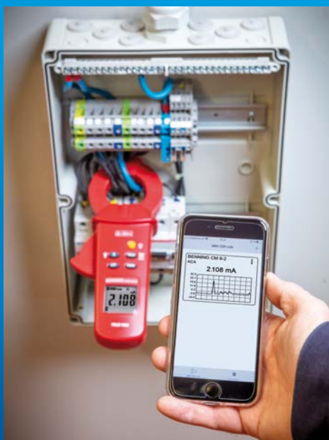
Fehlersuche in einer elektrischen Anlage und Protokollierung über App BENNING MM-CM Link