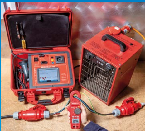
Differenzstrommessung an einem 3-phasigen Betriebsmittel über alle aktiven Leiter