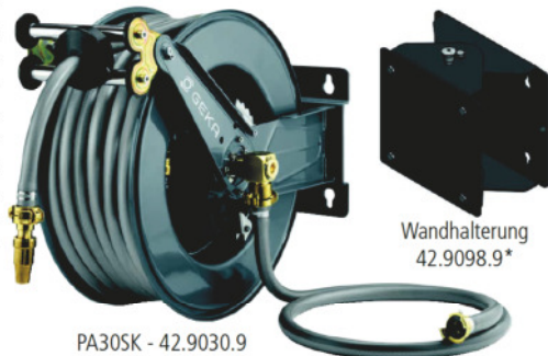
PA30SK - 42.9030.9