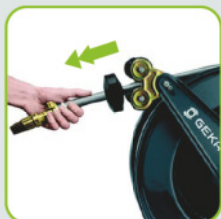
Arretierung durch Zug am Ende des Schlauchs steuerbar