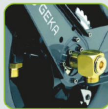
GEKA® plus Armatur und Rohr mit vollem 3/4" Wasserdurchfluss