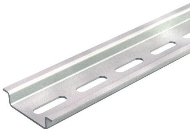
Hutprofilschiene 35 x 7,5 mm nach DIN EN 60715 (früher DIN EN 50022).