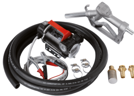
BATTERY KIT 3000 INLINE