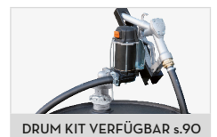
DRUM KIT VERFÜGBAR S.90