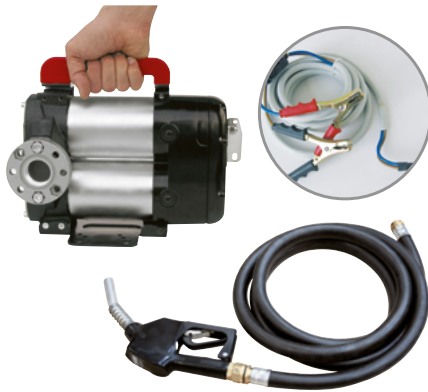
BATTERY KIT BIPUMP