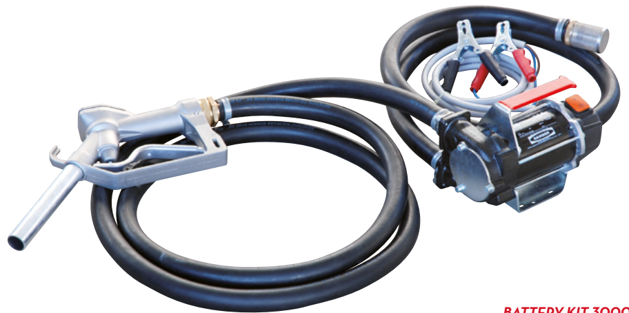
BATTERY KIT 3000