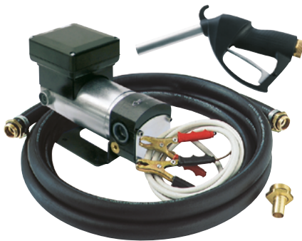
BATTERY KIT OIL