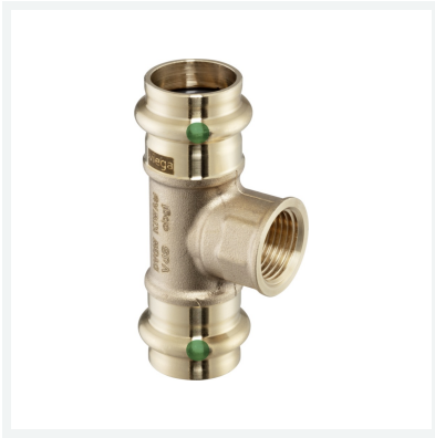
Sanpress-T-Stück mit SC-Contur Modell 2217.2 Artikel 361 228