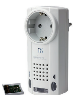
Funksignalgerät für Serie TASTA