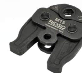
M - V 12 - 35 mm

RP 219 bietet über das integrierte OLED-Display und die Bluetooth Verbindung zu der kostenfreien App RIDGID Link, vollen Zugriff auf wichtige Werkzeuginformationen wie Anzahl der Presszyklen, Wartungsintervall, Betriebsstunden, Pressdruck, Akkustatus, Werkzeugwarnungen usw.