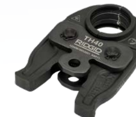
TH - U - G - RF 12 - 40 mm