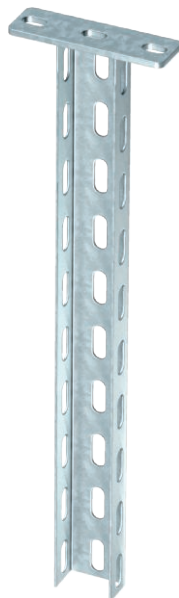
Hängestiel (U-Profil) in der Abmessung 50 x 30 mm mit angeschweißter Kopfplatte.