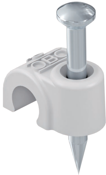
ISO-Nagel Clip, Kurze Bauform